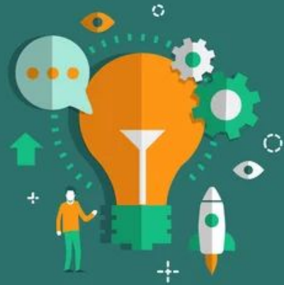
INNOVATION AND DISCOVERY