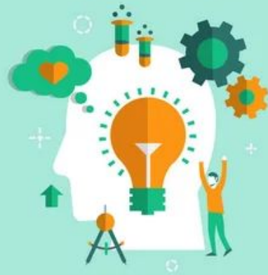
IDEA AND IMAGINATION