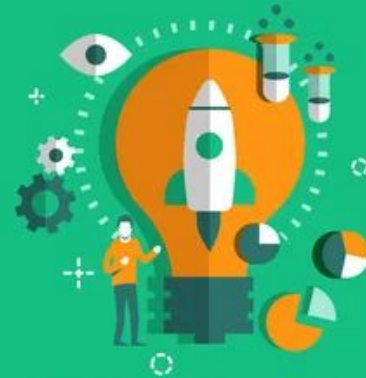
INNOVATION AND RESEARCH